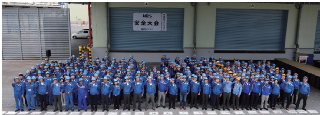
写真は当日の参加者一同

2024年は5月25日に開催し、PS事業部及び熊本支店、計国内8拠点が日ごろの成果を発表しました。今年度はコロナ禍以来となる現場研修となり海外拠点のメンバーも参加し、大々的に開催いたしました。今後も安全目標達成のため、One NRSとして事故予防に努めてまいります。