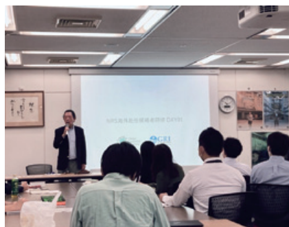
海外赴任候補者研修