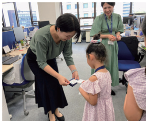
▲お父さん、お母さんの同僚と名刺交換