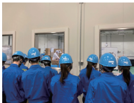
新入社員 現場見学会