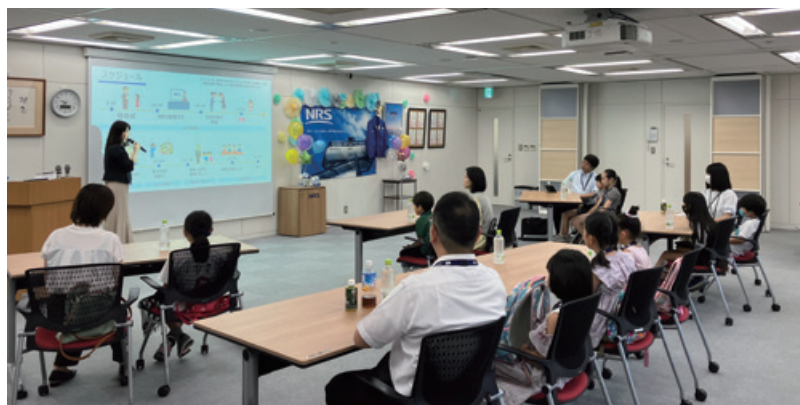
▲NRSグループの事業説明

本社従業員の子どもの対象とした「子ども参観日」を実施しました。「子ども参観日」は、従業員の子もたちが親の職場を訪問することで、家族の仕事への理解を深め、ワークライフバランスを推進するとともに、社内コミュニケーションの活性化を目的としています。従業員エンゲージメント向上に取り組むとともに、未来を担う子どもたちへ学びの場を提供する活動を続けてまいります。